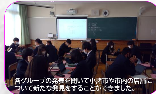
各グループの発表を聞いて小諸市や市内の店舗について新たな発見をすることができました。